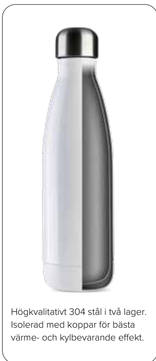
Högkvalitativt 304 stål i två lager. Isolerad med koppar för bästa värme- och kylbevarande effekt.